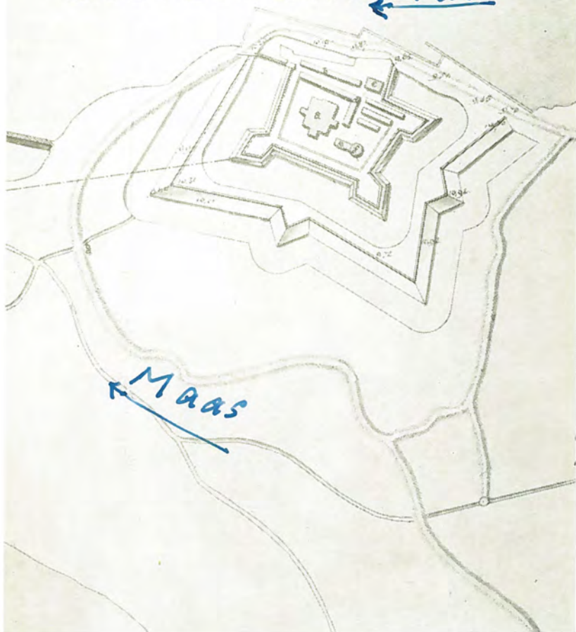
LOEVESTEIN in 1830