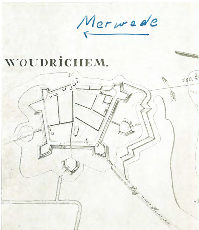
Plan van WOUDRICHEM.