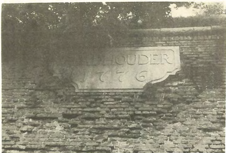
Naamsteen 1776 van het bastion Stadhouder in de Hoge Bossche Fronten te Maastricht.