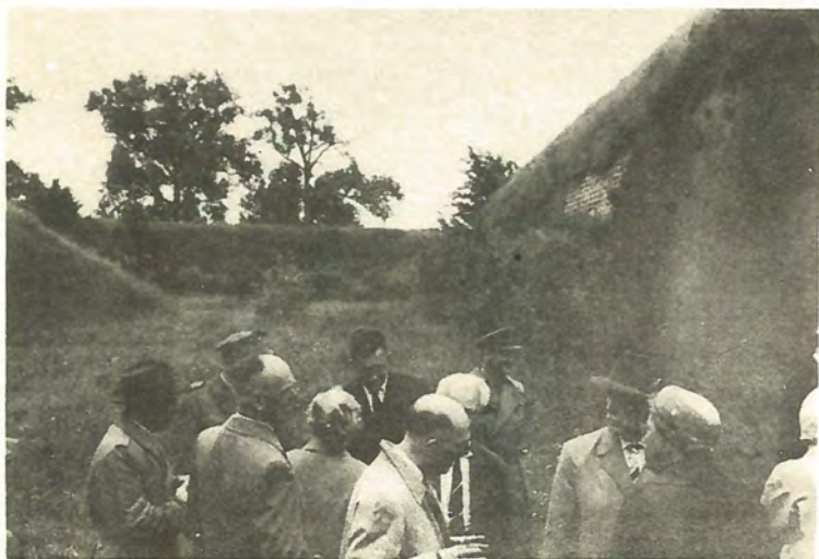
Groep deelnemers aan de excursie op 11 juni 1960 naar Maastricht, tijdens het bezoek aan de Hoge Bossche Fronten te Maastricht.