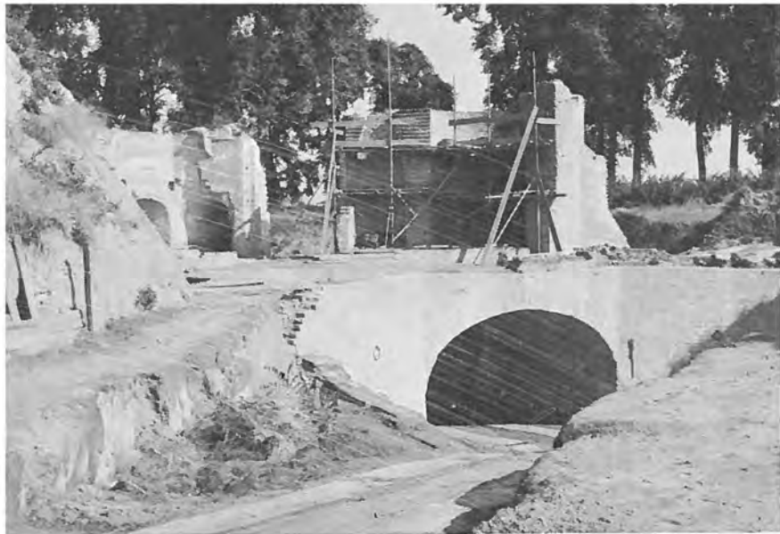
De Middeleeuwse "Dobbele Poort" te HULST 1506, weder ontgraven 1957 e. v. j.