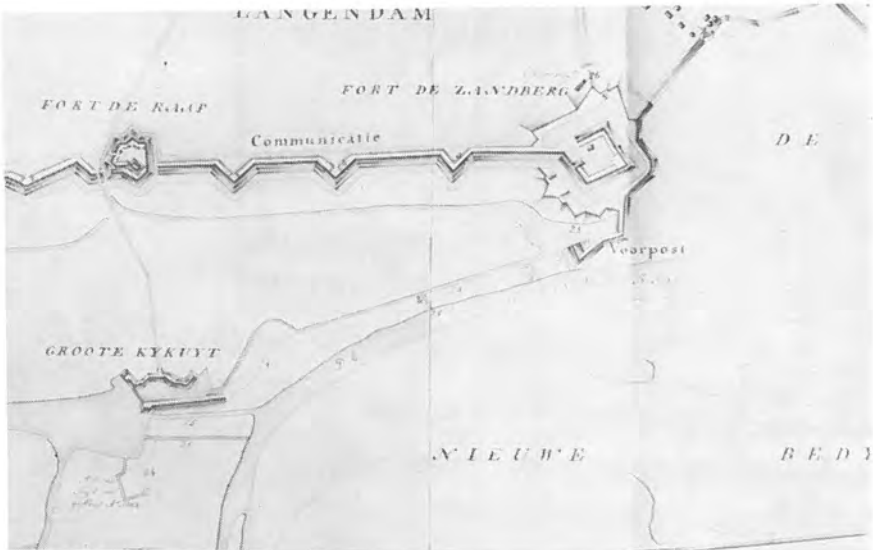
Dostelijke helft van de linie bij HULST, c. 1785, met de forten de Paap, Kijkuit en Zandberg. (Alg. R. A. Plans v. Vestingen H 823)