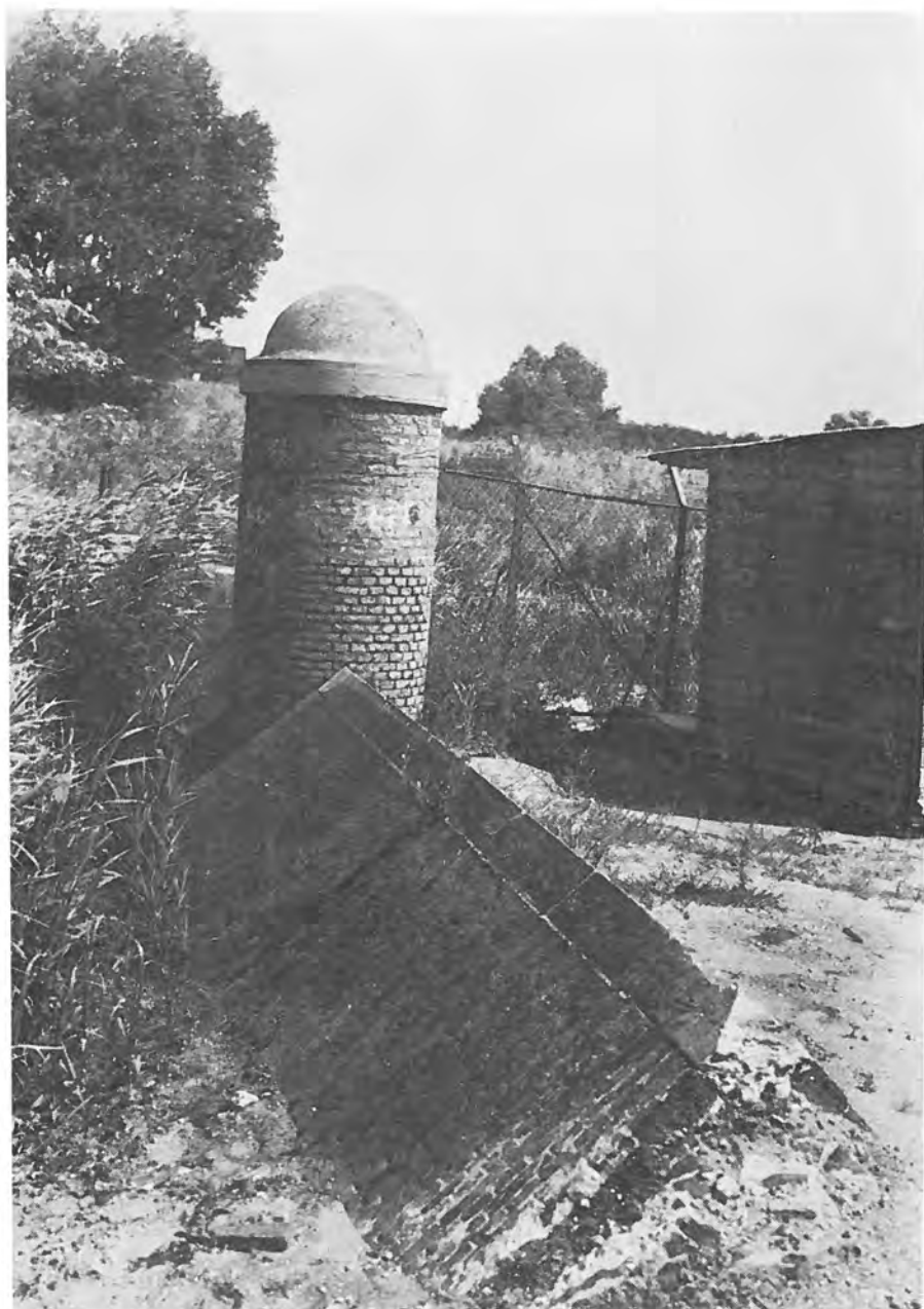
I. MUIDEN. Westbeer met monnik.