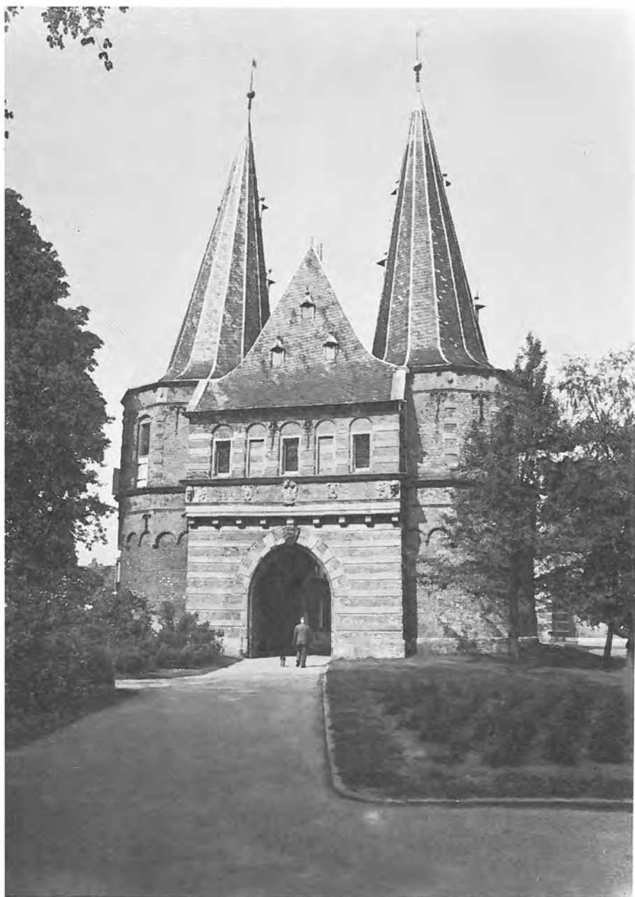
III. KAMPEN. Cellebroederspoort (Veldzijde).