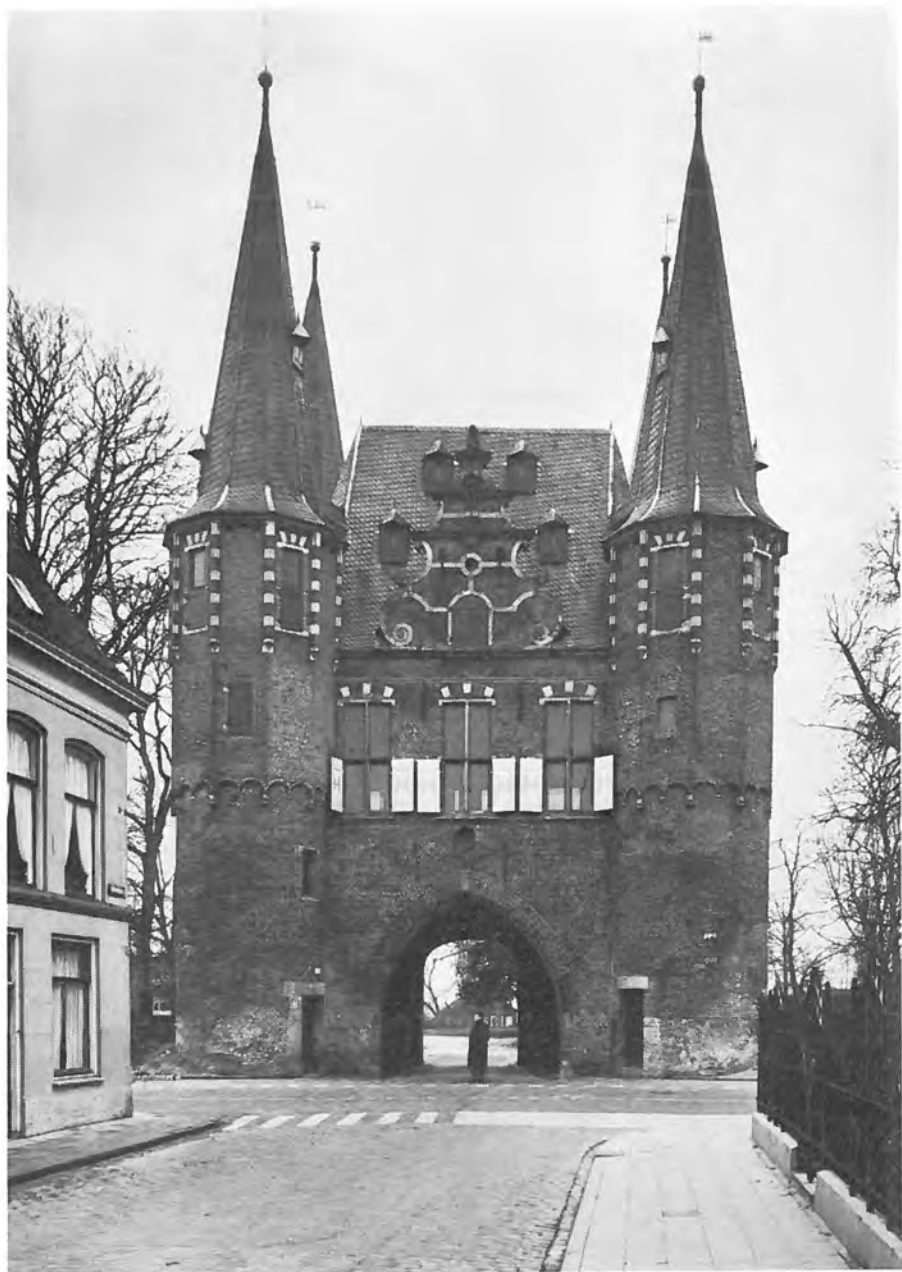
II. KAMPEN. Broederpoort (Stadszijde).