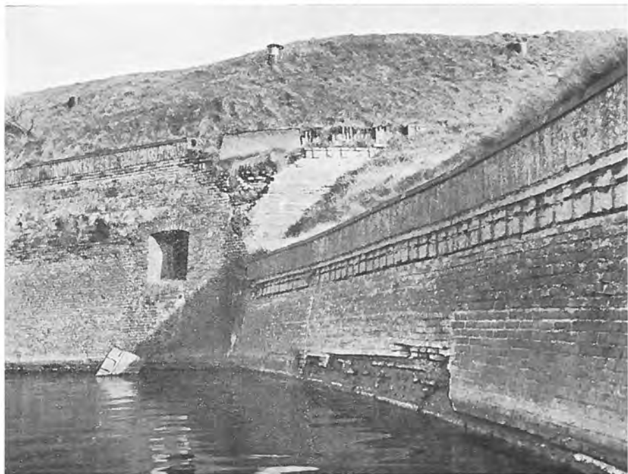
Hoek van bastion vóór de restauratie