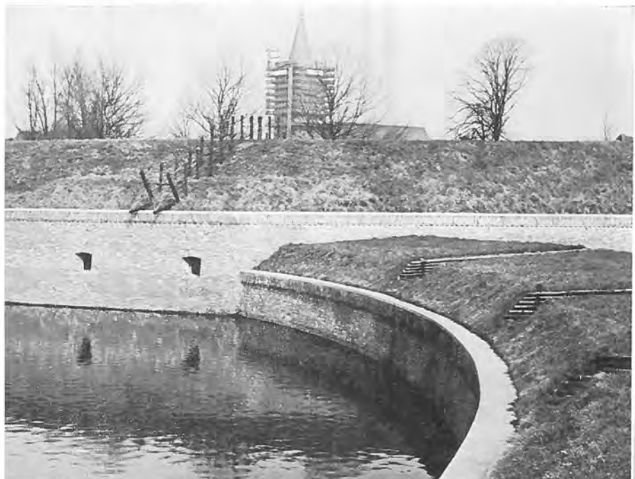
Hoek van bastion ná de restauratie