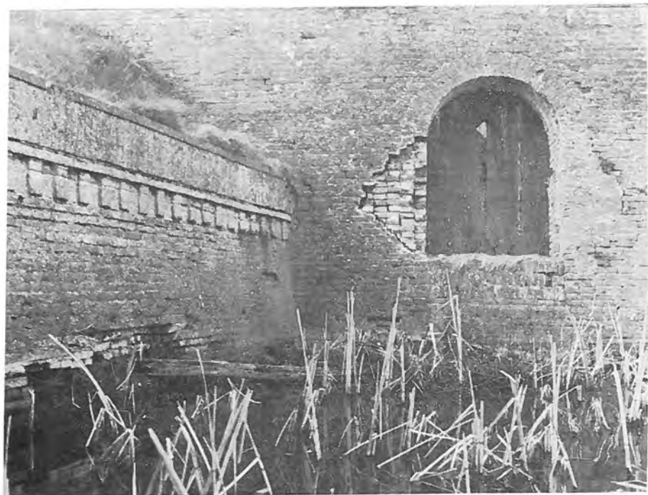
Schouderhoek bastion vóór de restauratie