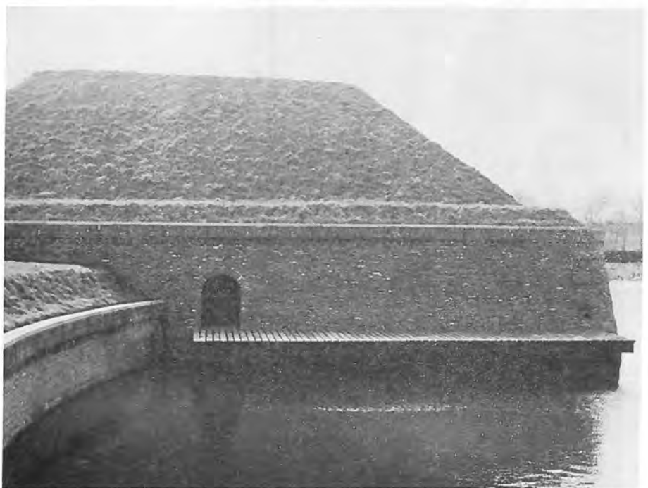
Schouderhoek bastion ná de restauratie