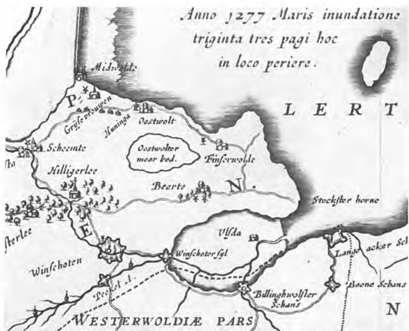
Fragment van een kaart van Wicheringe, ca. 1630 (atlassen van Blauw en Janssonius), waarop 3 van de 4 redouten aan de Pekel A.