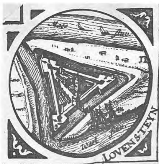
Het kasteel Loevesteyn met driehoekige omwalling, ca. 1634.