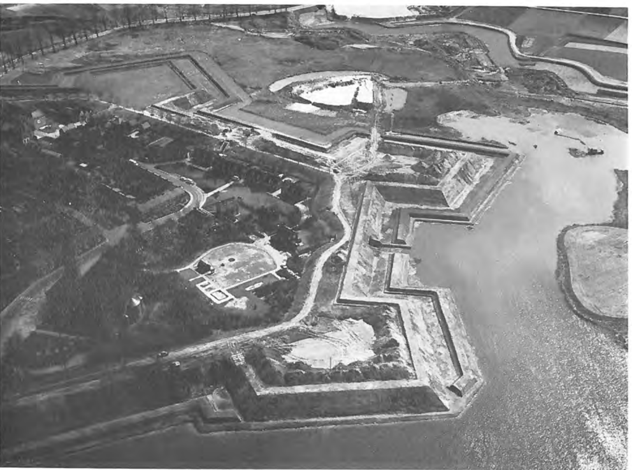
HEUSDEN. Restauratie van de vesting. Van links boven tot rechts beneden : Afb. 1 Zuider-, Wester- en Noorderbastion.