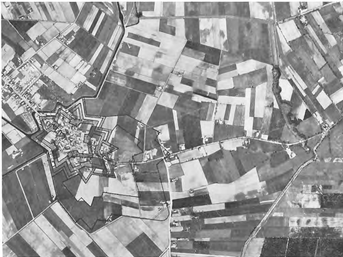
Luchtfoto 1957, met ingetekende vestingwerken uit kavellijnen herleid.